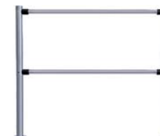
Стационарная секция ограждения серии PERCo-BH02 без заполнения