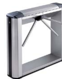
Электронная проходная PERCo-KT05.4 в комплекте со стандартными планками