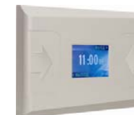
Контроллер регистрации PERCo-CR01