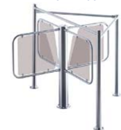
Турникет PERCo-RTD-03S с формирователем PERCo-RB-03S