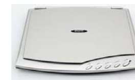
Сканер Plustek OpticSlim 500+