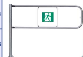
Поворотная секция ограждения серии PERCo-BH02 со стопорным механизмом