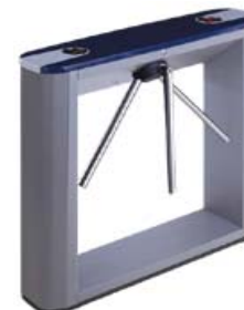
Тумбовый турникет-трипод с планками Антипаника PERCo-TTD-03.1G