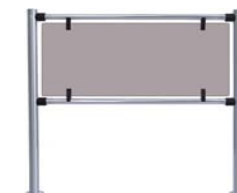
Стационарная секция ограждения серии PERCo-BH02 с заполнением