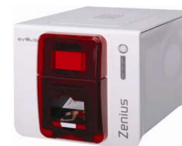
Принтер Evolis Zenius USB