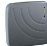
Считыватель дальнего действия PERCo-IR10