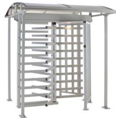
Полноростовый роторный турникет PERCo-RTD-15R с крышей PERCo-RTC-15R