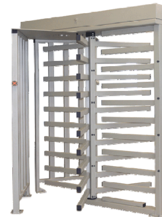
Полноростовый роторный турникет PERCo-RTD-15R