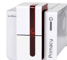
Принтер Evolis Primacy, USB & Ethernet