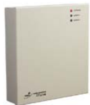
Контроллер замка/турникета PERCo-CT/L04