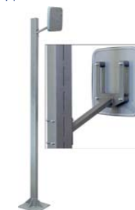
Стойка PERCo-BH03 и считыватель PERCo-IR10 с кронштейном