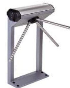
Электронные проходные PERCo-KT02 в комплекте со стандартными планками