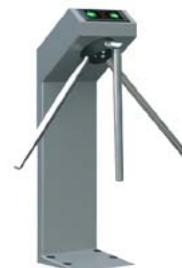
Турникет-трипод с планками Антипаника PERCo-TTR-04.1G