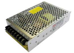
Блок питания NES-150-24