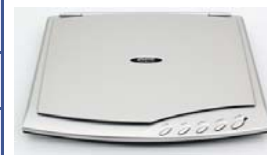
Сканер Plustek OpticSlim 500+