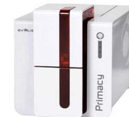
Принтер Evolis Primacy, USB & Ethernet