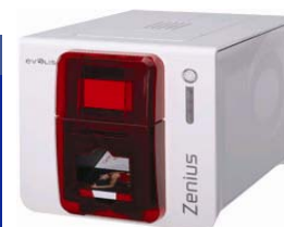
Принтер Evolis Zenius USB