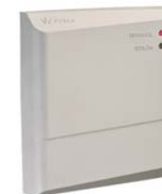
Контроллер управления доступом PERCo-SC-820