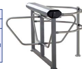
Электронная проходная PERCo-KR05.4