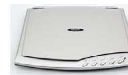
Сканер Plustek OpticSlim 500+