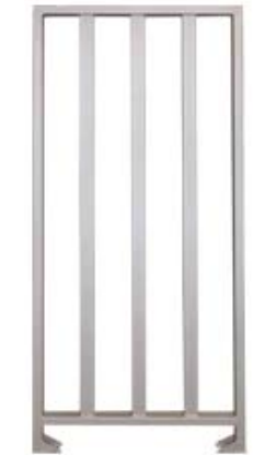
Секция полноростового ограждения серии PERCo-MB-15