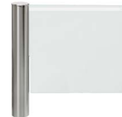
PERCo-WMD-06 с преграждающей створкой