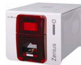
Принтер Evolis Zenius USB