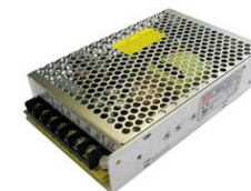
Блок питания NES-100-12