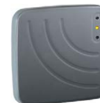
Считыватель дальнего действия PERCo-IR10