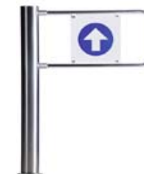
PERCo-WMD-05S с преграждающей створкой