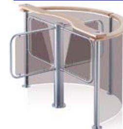
Турникет PERCo-RTD-03S с формирователем PERCo-RB-03TP