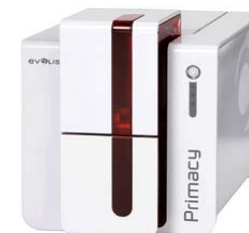
Принтер Evolis Primacy, USB & Ethernet