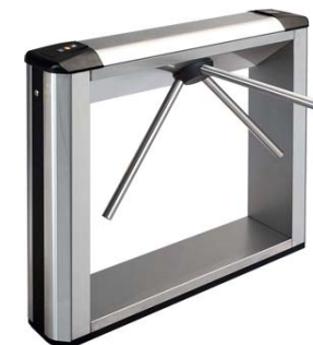
Электронная проходная PERCo-KTC01.4 в комплекте со стандартными планками