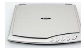
Сканер Plustek OpticSlim 500+