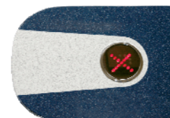
Крышка турникета с индикатором PERCo-C-03G blue