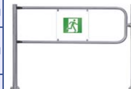
Поворотная секция ограждения серии PERCo-BH02 с электро-магнитным устройством блокировки