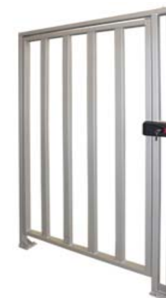
Полноростовая калитка PERCo-WHD-15R

ПРИМЕЧАНИЕ: Под заказ возможна окраска калиток без привода PERCo-WHD-15 в другие цвета по каталогу RAL. Срок изготовления и стоимость оговариваются дополнительно.