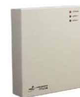
Контроллер замка/турникета PERCo-CT/L04