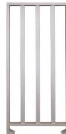
Секция полноростового ограждения серии PERCo-MB-15