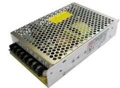
Блок питания NES-150-24