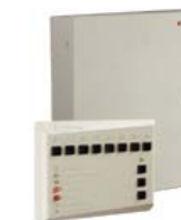
Прибор приемно- контрольный охранно-пожарный PERCo-PU01