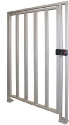
Полноростовая калитка PERCo-WHD-15R