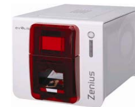
Принтер Evolis Zenius USB